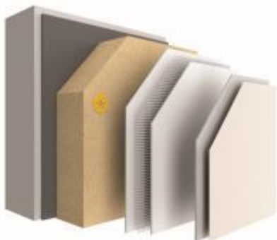
Nouveau système ITE StoTherm AimS® avec isolant en fibre de bois