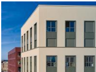
Programme Woodstone, Bordeaux (33)