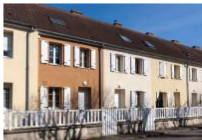
Premier chantier réalisé en StoTherm AimS® sur fibre de bois à Pont-Sainte-Maxence, dans l'Oise.