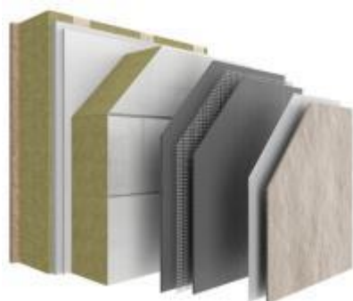
StoTherm Mineral COB

Le Carrefour International du Bois, qui se tiendra du 2 au 4 juin 2026, au Parc des Expositions de la Beaujoire à Nantes, sera l'occasion pour le leader mondial et français de l'isolation thermique par l'extérieur, également spécialiste du ravalement et de l'embellissement des façades, de mettre en avant ses solutions de façade innovantes, spécialement conçues pour répondre aux enjeux de la RE2020 et accompagner la transition vers une construction plus durable.