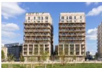
Résidence IKSSO, Bordeaux (33)

Le système StoVentec R Enduit a été mis en œuvre en 2025, avec Bouygues Immobilier, sur les façades à ossature bois préfabriquées de deux des quatre bâtiments de la résidence IKSSO, à Bordeaux composée de 94 logements.