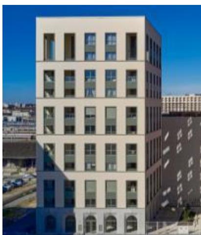
Programme Woodstone, Bordeaux (33) Une première pour un bâtiment en structure bois de 3 e famille : la tour Wood à Bordeaux a bénéficié d'une ITE sous enduit grâce à une appréciation technique d'expérimentation (ATEX).

Aujourd'hui, la pose d'une isolation thermique par l'extérieur sous enduit (ETICS) sur des bâtiments à ossature bois est devenue une pratique courante, portée par le développement de systèmes dédiés. Plébiscité dans le logement collectif comme en maison individuelle , l'enduit combine des atouts économiques et techniques (performance thermique, résistance mécanique, sécurité incendie), tout en offrant une large palette de finitions : couleurs, aspects et natures de revêtements (minéral, chaux, silicate, silicone...).