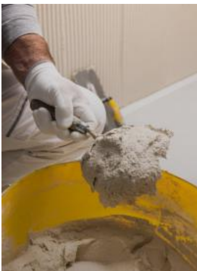
Nouveau sous-enduit d'ITE sans ciment StoLevell Neo AimS®